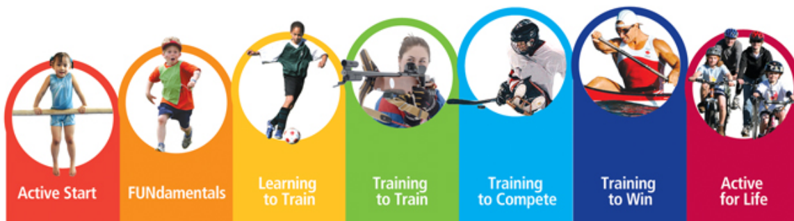
Figuur 1. LTAD Canada (Balyi, 2013)

Het Long-Term Athlete Development Model (LTADM) gaat uit van een indeling van een sportloopbaan in zeven verschillende ontwikkelingsfasen (Figuur 1). Het is een leidraad voor elk organisatieniveau in het maken van de juiste beslissingen in het belang van talentontwikkeling in de sport. Ook voor trainers en coaches is het een uitgangspunt voor het begeleiden van sporters en bij het ontwikkelen van jaarplannen en meerjarenopleidingsplannen. Het streeft naar maximale ontwikkeling van alle sporters om uiteindelijk podiumprestaties neer te zetten en bovenal het bevorderen van levenslange plezier in het sporten. Het LTADM beschrijft optimale trainingen, wedstrijden en herstelprogramma's hoofdzakelijk gebaseerd op biologisch leeftijd boven chronologische leeftijd. Het model biedt mogelijkheden om sporters op verschillende manieren te trainen op het moment wanneer dit de grootste invloed heeft op het lichaam, door het toepassen van kennis uit de wetenschap op het gebied van lichaamsbeweging en basisprincipes over groei en biologische rijpingsnelheid van het menselijk lichaam. Daarnaast worden de intellectuele, emotionele en sociale ontwikkelingen van de sporter benadrukt, als aanvulling op het feit dat sport een positieve rol kan spelen op de ontwikkeling en vorming van een gezond, functioneel en productief individu.