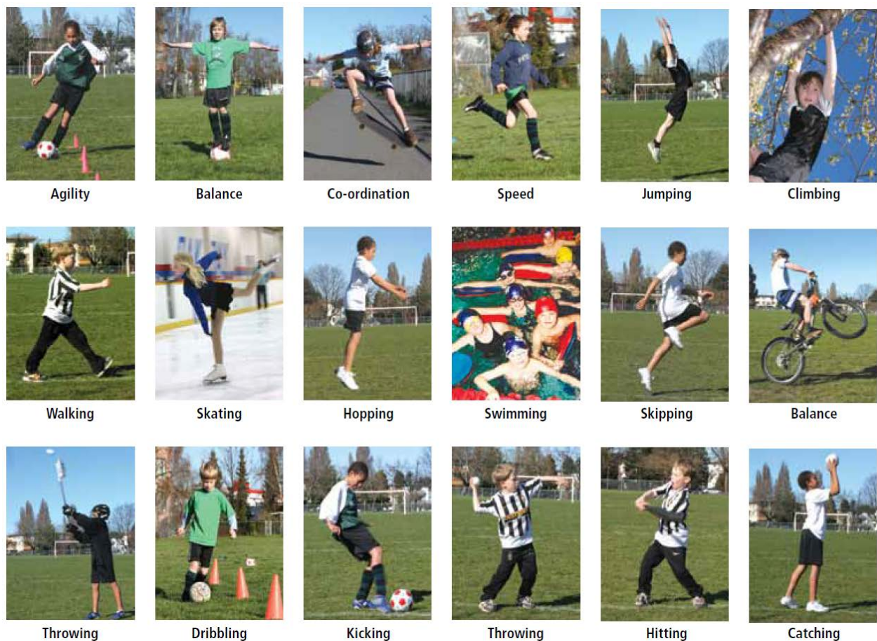
Figuur 2. Voorbeelden van fundamentele bewegingsvaardigheden (LTAD, 2014; Athletic Skills Model, Wormhoudt, Teunissen & Savelsbergh, 2012).

Fundamentele bewegingsvaardigheden en sportvaardigheden moeten worden aangeleerd in een leuke, veilige leeromgeving door middel van leuke activiteiten en spellen, zodat de kinderen de kans krijgen om te ontdekken wat ze leuk vinden en waar ze goed in zijn. Het is belangrijk dat kinderen de basis van fysieke competentie ontwikkelen voor de groeispurt.